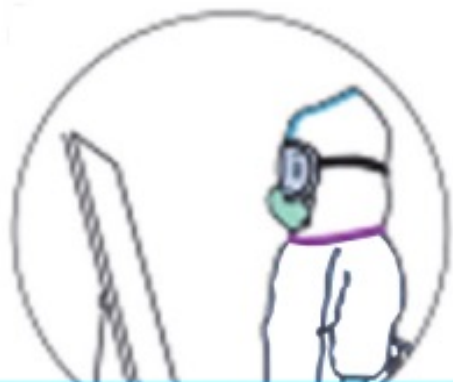
全面检查防护用品穿戴情况 确保穿戴符合规范