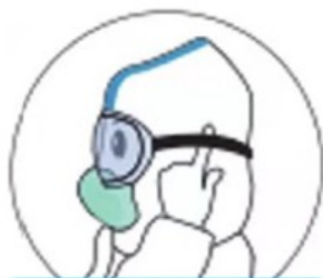
摘除护目镜/防护面屏