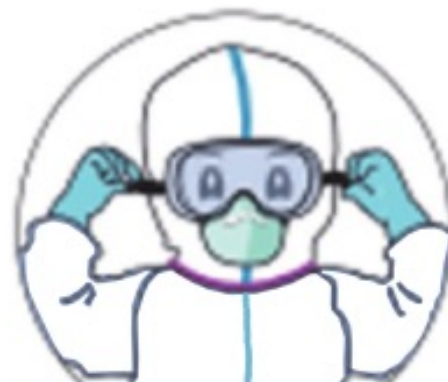
戴护目镜/防护面屏