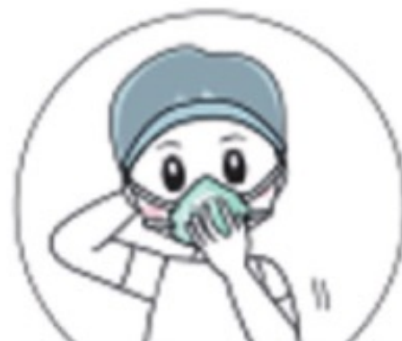
戴医用防护口罩/N95 口罩(进行口罩密闭性 测试,确保密闭性良好)