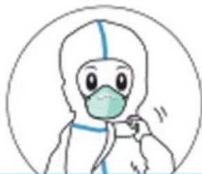
脱除医用防护服、手套、鞋套 (从内向外向下反卷,动作轻柔, 防护服、手套、鞋套一并脱除)